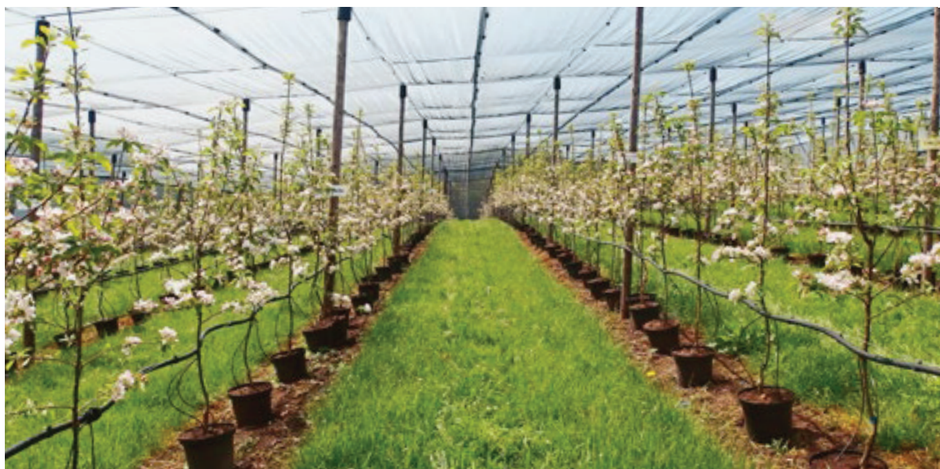
Parcelle de quarantaine au centre de fruit à noyau, Agroscope Breitenhof, pendant la floraison des pommiers.

Depuis 10 ans déjà, le Breitenhof à Wintersingen (BL) dispose d'une parcelle de biosécurité permettant des inoculations artificielles pour tester des préparations contre le feu bactérien. En 2023, dans le cadre du projet «HERAKLES Plus», diverses combinaisons de produits homologués et de produits encore non autorisés ont été testées dans cette parcelle. Certaines combinaisons ont débouché sur des résultats encourageants.